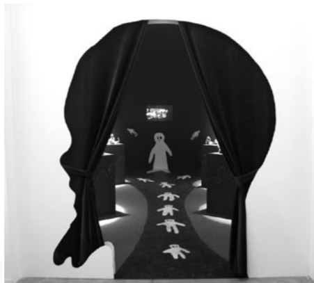
Once upon no time Biennale d'Art Contemporain de Lyon, 2005 © Fabien Verschaere

Fabien Verschaere est aujourd'hui l'une des figures majeures de la scène artistique française. Du 16 février au 29 avril 2007, le Musée d'Art Contemporain de Lyon rend hommage à l'oeuvre onirique et fantastique de cet artiste hors catégorie. L'exposition de Lyon est une création spécifique révélatrice de ses obsessions, et intitulée Seven Days Hotel . Plongeant le visiteur dans un monde tour à tour féerique et cauchemardesque, l'artiste transforme l'espace d'exposition en un décor d'hôtel, divisé en 7 chambres, mêlant céramiques, fresques, aquarelles, sons et vidéos.