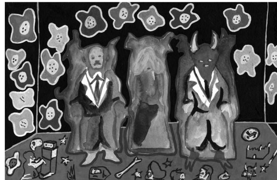
Dessin préparatoire Seven Days Hotel , 2007 © Fabien Verschaere

Le catalogue de l'exposition (français/anglais) est édité par Panama Musées. Il réunit une abondante iconographie, des essais de Paul Ardenne et Jérôme Sans ainsi qu'un entretien de Peter Doroshenko. Edité après l'inauguration afin de contenir des vues de l'exposition, il est possible de le réserver à la boutique du musée.