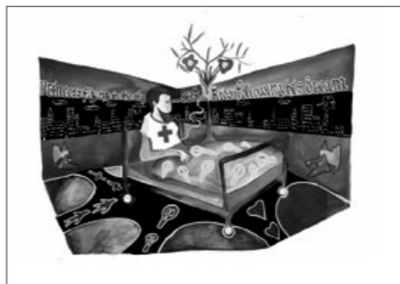
Dessin préparatoire Seven Days Hotel , 2007 © Fabien Verschaere

Au cours de ses nombreux voyages, l'artiste fréquente souvent ce lieu de transit ; tantôt escale propice au repli sur soi et à la réflexion intime, tantôt espace de perte permettant d'assouvir mille fantasmes. Ici, l'hôtel est un "hôtel-cerveau", un réceptacle autant qu'un souvenir de la bulle hospitalière de son enfance.